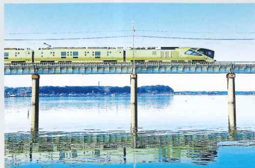
鹿島線（延方～鹿島神宮）を走行する「TRAIN SUITE 四季島」

2017年5月1日に運行を開始した「TRAIN SUITE 四季島」は、地域の皆さま、駅やグループ会社の皆さんなど、社内外の多くの方々に支えていただきながら、今年5月に運行5周年を迎えました。緊急事態宣言により運休も発生しましたが、これまでに8000名以上のお客さまにご利用いただいています。今年は、これまで支えてくださった地域の皆さま、関係の皆さまへの感謝をお伝えするとともに、より多くの皆さまに「TRAIN SUITE 四季島」を知っていただくため、運行5周年企画を実施しています。