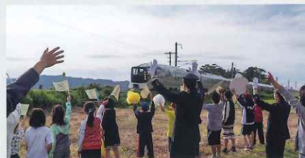
沿線から手を振ってくださる地域の皆さま

リニューアルにより、「TRAIN SUITE 四季島」が初めて停車する駅や、これまで通過していなかった時間帯で「TRAIN SUITE 四季島」をご覧いただけることになりました。東日本各地を走行する「TRAIN SUITE 四季島」を見かけたら、ぜひ駅や沿線から温かく手を振ってください。