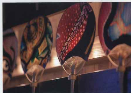
「世界にひとつだけのうちわ」製作体験 (3泊4日、黒石コース)

1泊2日コースでは、「みなとまちが育んだ豪商の粋と、豊かな里山の恵みを味わう旅。」をテーマに、新潟県で豪商の文化に触れ、2日目は、季節によって山梨・長野のワイナリーをそれぞれ訪れます。3泊4日コースでは、「大自然の織りなす風景と、受け継がれてきた悠久の文化にふれる旅。」として、これまでのコースとは逆回りで東日本を周遊します。上野駅出発後は日本海側を北上し、北海道の函館・道南をめぐり、雄大な景色や海の幸、アイヌ文化などの歴史に触れます。その後本州では、青森県、宮城県に立ち寄りながら東北の文化に触れていただきます。